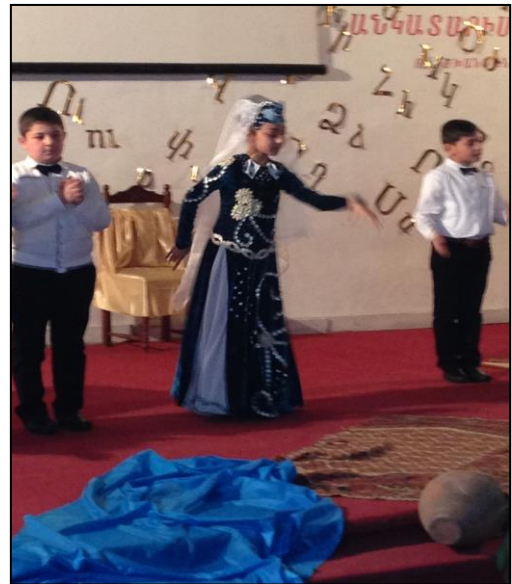
IV Բ դասարան